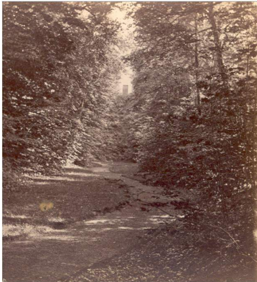
Het laat 18e-eeuwse wandelpad door het dal naar de koepel op een foto uit 1860.