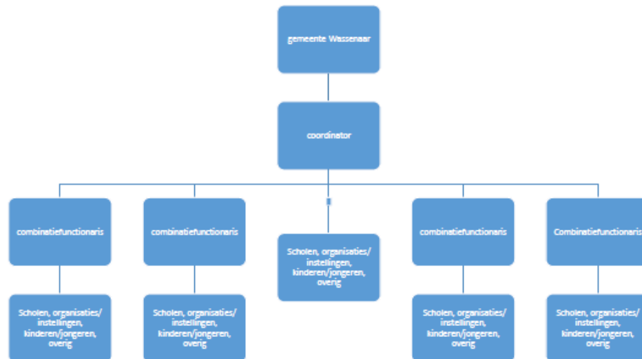
Figuur 1: Organogram Talentum

In het kort is Talentum dus verantwoordelijk gemaakt voor de invulling van het brede school arrangement in Wassenaar, gericht op kunst, cultuur, sport en natuur. Dit wordt in samenspraak gedaan met de scholen, en wordt daardoor afgestemd op de behoeften en wensen. De combinatiefunctionarissen binnen Talentum zijn daarmee de verantwoordelijkheid gegeven een evenwichtig en sluitend aanbod op cultuur, sport en kunst te ontwikkelen en te organiseren. Talentum is hiervoor verantwoordelijk tot 31 december 2020.