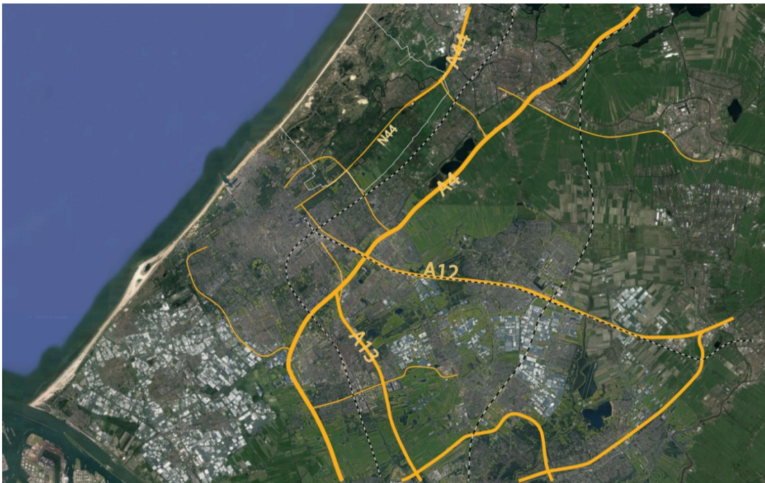
situering N44 in de regio

Aan de hand van deze sessies kunnen één of meerdere kansencarten geformuleerd worden voor de A44/N44, waarna concreet coalitiepartners gevraagd kan worden te participeren.