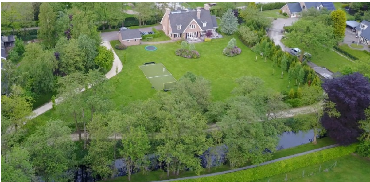
Afbeelding 1: Huidige situatie Raaphorstlaan 19b

Het principeverzoek bevat naast de aanleg van een zwembad ook de uitbreiding van de bestaande woning, inclusief overkapping. Omdat de uitbreiding van de woning en overkapping wel binnen de mogelijkheden van het bestemmingsplan passen, zijn deze in het besluit op het principeverzoek achterwege gebleven.