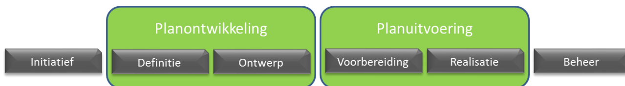
Figuur 4: De fasen van gebiedsontwikkeling

Daarom wordt in de gemeente Wassenaar projectmatig gewerkt in de volgende zes fasen (figuur 4) van gebiedsontwikkeling.