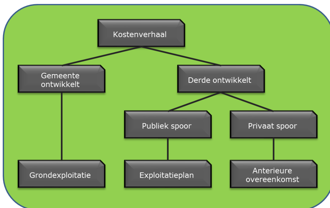
Figuur 3: vormen van kostenverhaal

Onderstaand figuur 3 geeft de vormen van kostenverhaal weer.