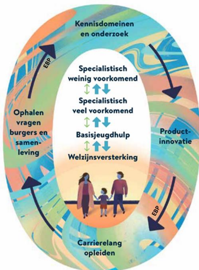
figuur: de Ontwikkelpijl